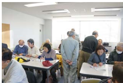
室内での実験の様子